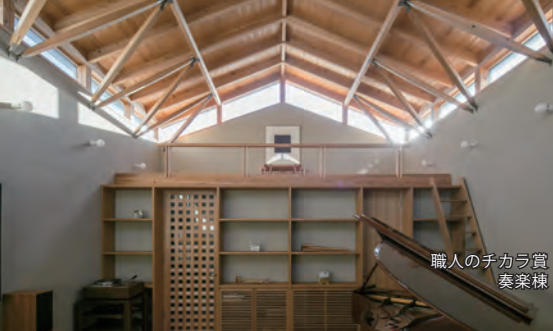
職人のチカラ賞 奏楽棟