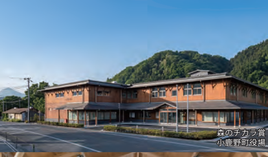
森のチカラ賞 小鹿野町役場