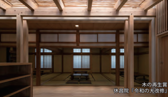
木の再生賞 休昌院『令和の大改修』