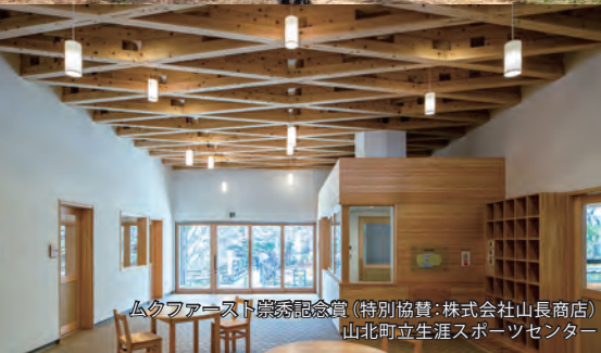
ムクファースト建築記念賞(特別協賛:株式会社山長商店) 山北町立生涯スポーツセンター