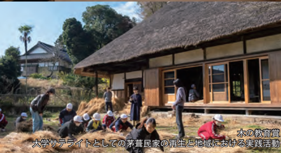
木の教育賞 大学サテライトとしての茅草民家の再生と地域における実践活動