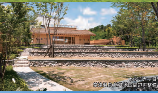
木のチカラ賞 草津温泉 地蔵地区周辺再整備